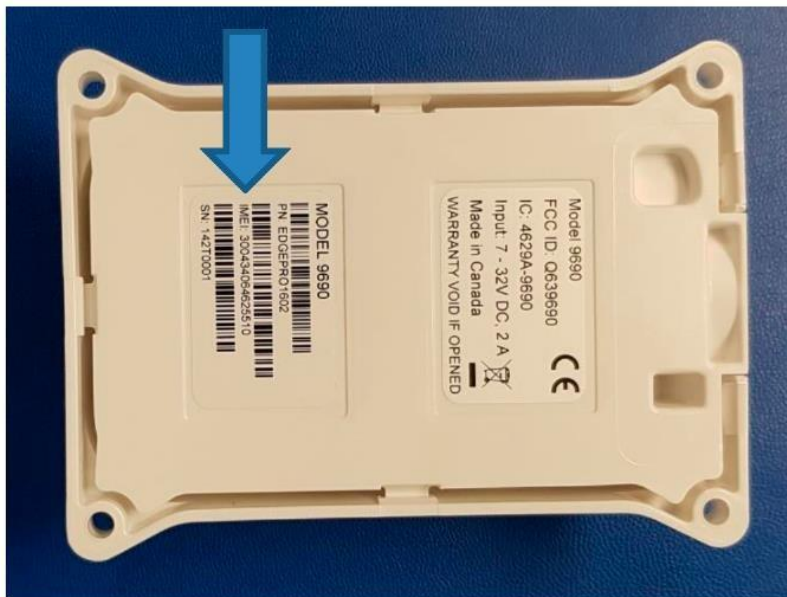
Рисунок 5-1: Расположение IMEI

Комплект поставки Iridium Edge Pro включает дополнительную этикетку IMEI в упаковочной коробке, как показано на Рисунке 5-2. Если Iridium Edge Pro установлен в труднодоступном месте или если его этикетка IMEI закрыта, можно дополнительно прикрепить запасную этикетку IMEI к доступному месту, чтобы обслуживающий персонал мог легко прочитать IMEI.