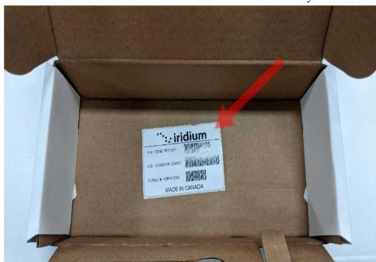
Рисунок 5-2: Запасная этикетка IMEI

Комплект поставки Iridium Edge Pro включает дополнительную этикетку IMEI в упаковочной коробке, как показано на Рисунке 5-2. Если Iridium Edge Pro установлен в труднодоступном месте или если его этикетка IMEI закрыта, можно дополнительно прикрепить запасную этикетку IMEI к доступному месту, чтобы обслуживающий персонал мог легко прочитать IMEI.